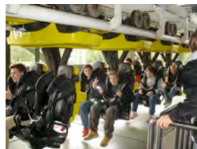
Fahrt in den Heidenpark