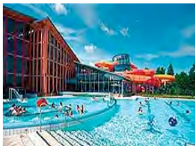
Fahrt ins Wonnemar