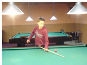
Besuch im Billardcafé