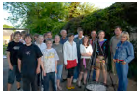
Cook & talk