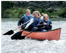
Paddeltour auf der Trave