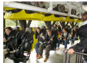
Fahrt in den Heidepark