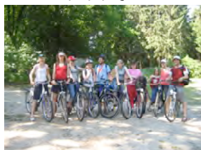
Fahrradtour mit Zelten